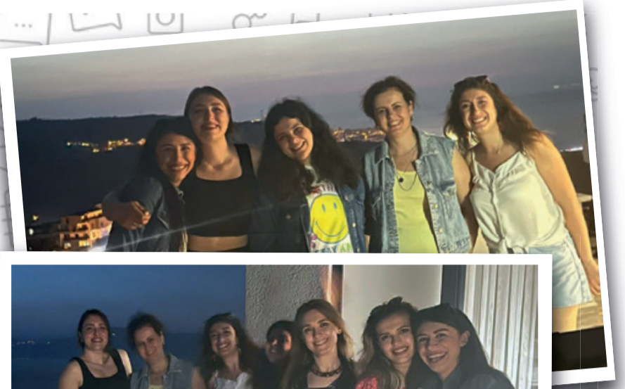
İnsan Kaynakları ekibi, hafta sonu terastaki mangal partisinde bir araya geldi!