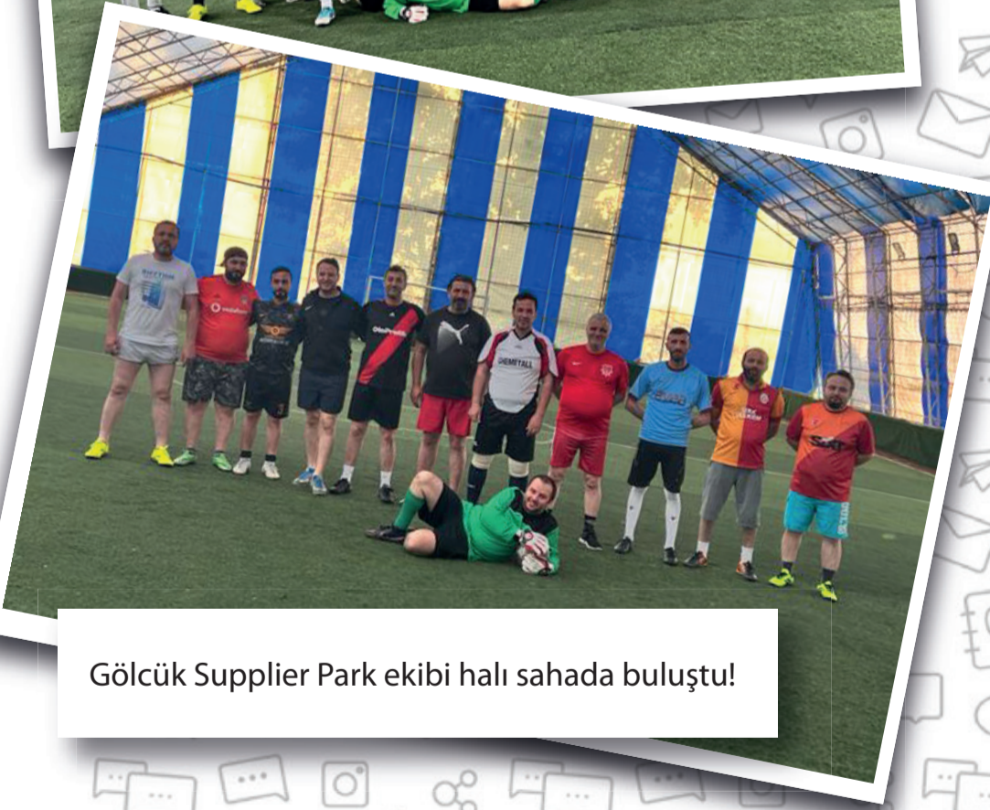
Gölcük Supplier Park ekibi halı sahada buluştu!